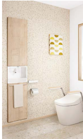
写真はメイプル柄です。