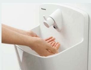
奥行:160mm 深さ:106mm 写真はラウンドタイプ

両手がすっぽりとボールに入るので、 しっかり洗えて、床へのトビハネが 軽減。傾斜のある形状で、 手の出し入れもスムーズです。