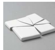
スゴピカ素材(有機ガラス系)