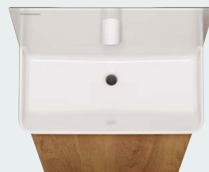
写真は据置きタイプ

陶器じゃない素材だから 実現できた、わずか7mm の薄型成形。 奥行もおさえ、手洗い スペースをより広く。