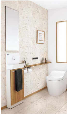
写真はチェリー柄です。