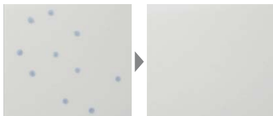
水温や水質によってはピンク色などの色の付いた汚れが発生する場合があります。 注)写真は実験用に人工の水アカを強制的に付着させたものです。