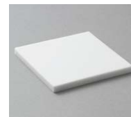
(割れにくさの比較)試験方法:重さ約200gの鋼球を40cmの高さから平板試験片に落下させる実験を実施。 ※当社基準に基づき行った実験結果であり、割れないこと、傷付かないことを保証するものではありません。

※1 研磨剤入りのブラシや研磨剤入りの洗剤はお使いいただけません。PP製トイレブラシ、中性トイレ用洗剤をご使用ください。