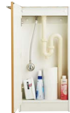
写真は据置きタイプです。