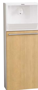
写真はソフトオーク柄です。